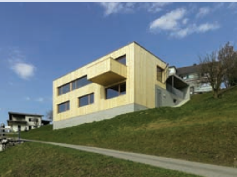
Architektur: HEIN-TROY, www.hein-troy.at